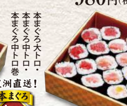
873 鉄火・とろ鉄火・トロたく巻 9貫入 1,850円 (税込)