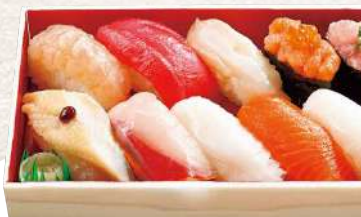
887 富崎 10貫入 1,270円 (税込)

えんがわ・パチマкру・イカ・サーモン・ピンチョウマグロ・ 玉子・むしえび・たこ・ネギトロ・彩りサラダ