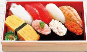
876 三坂 8貫入 740円 (税込)

◆全品にお吸い物・醤油・はしが付いています。◆寿司桶に変更も可能です。お気軽にお申し出下さい。