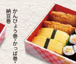
875 箱のり玉いなり 7貫入 560円 (税込)