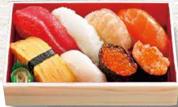
879 原歌 8貫入 990円 (税込)