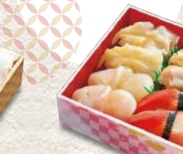
852 貝づくし 8貫入 980円 (税込)