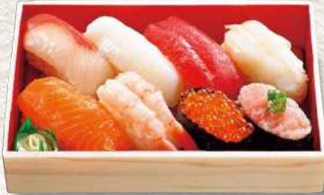
881 船瀬 8貫入 1,280円 (税込)