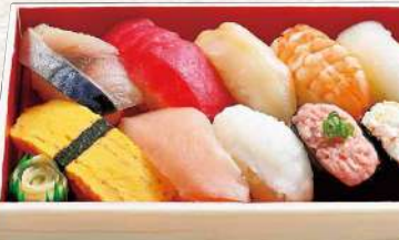
885 洲崎 10貫入 980円 (税込)

ピンチョウマグロ・パチマкру・イカ・むしえび・こはだ・ 玉子・北寄貝・たこ・いそっ子・彩りサラダ