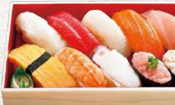
886 新湊 10貫入 1,000円 (税込)

しめ鯖・パチマкру・ツブ貝・むしえび・イカ・玉子・ ピンチョウマグロ・えんがわ・ネギトロ・彩りサラダ