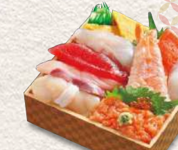
898 上ちらし寿司 1,480円 (税込)