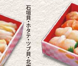
853 特上貝づくし 8貫入 1,620円 (税込)