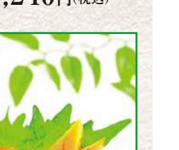
876 ぐんかん3色 9貫入 730円 (税込)