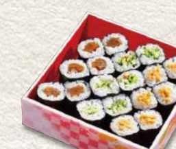
874 かんびょう・かつぱ・納豆巻き 9貫入 660円 (税込)