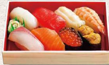
882 神岬 8貫入 1,380円 (税込)