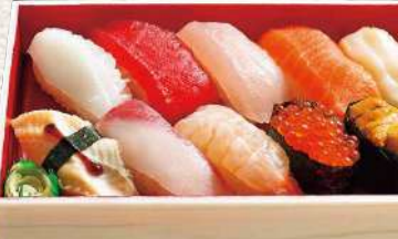
891 玄界 10貫入 1,740円 (税込)

生えび・ピンチョウマグロ・パチマкру・本まぐる中トロ・ ツブ貝・煮穴子・イカ・サーモン・ネギトロ・親子軍艦