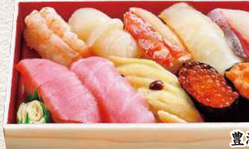
892 大瀬 10貫入 2,050円 (税込)

えんがわ・パチマкру・ピンチョウマグロ・サーモン・ ツブ貝・煮穴子・ぶり・生えび・いくら・うに