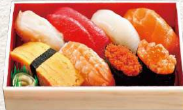
878 相泊 8貫入 830円 (税込)