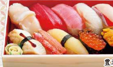
893 札前 10貫入 2,320円 (税込)

甘えび・ホタテ・かに・ひらめ・昆布・ぶり・本まぐる中トロ・ 本まぐる大トロ・煮穴子・いくら・親子軍艦