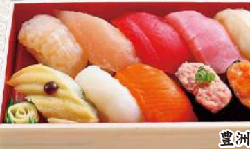
890 乙浜 10貫入 1,340円 (税込)

生えび・パチマкру・ツブ貝・親子軍艦・ネギトロ・ 煮穴子・ぶり・えんがわ・サーモン・イカ