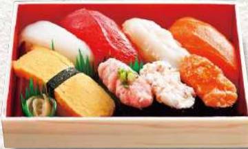
877 浅海 8貫入 790円 (税込)