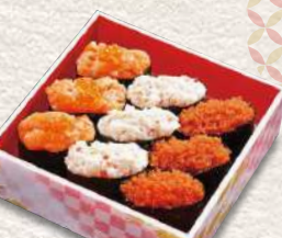
856 ぐんかん3色 9貫入 730円 (税込)