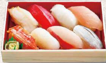
880 小樽 8貫入 1,140円 (税込)