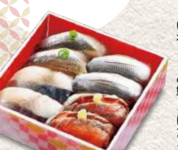
855 ひかり4色 8貫入 780円 (税込)