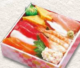
897 ちらし寿司 1,000円 (税込)