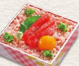
896 月見トコ鉄火 1,110円 (税込)

ホタテ・パチマкру・本まぐる中トロ・たい・ぶり・煮穴子・ かに・数の子・いくら・うに