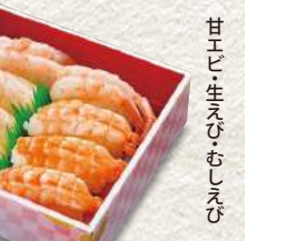
855 特上えびづくし 8貫入 1,620円 (税込)