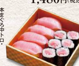
872 本まぐる大トロ中トロセット 7貫入 2,300円 (税込)