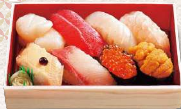
883 美国 8貫入 1,650円 (税込)