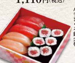
870 まぐろづくし 7貫入 1,100円 (税込)