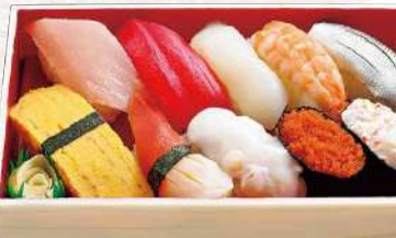
884 友知 10貫入 930円 (税込)

ピンチョウマグロ・パチマкру・イカ・むしえび・こはだ・ 玉子・北寄貝・たこ・いそっ子・彩りサラダ